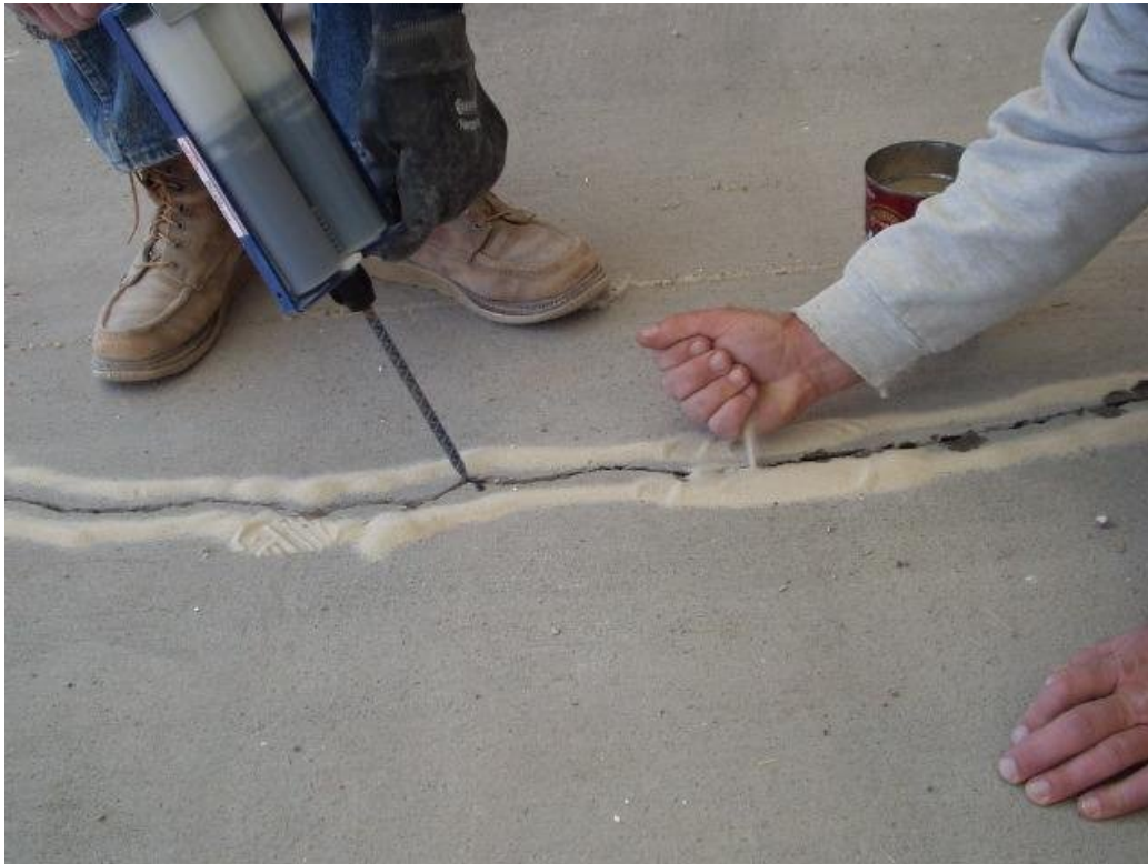
استخدام حقن البوليمرات

وهناك فصيلة أخرى من الروابط تتكون من البوليمرات البلاستيكية وهي سريعة التصلب ولا تلتصق بالخرسانة ، وهي ذات انكماش عال في الظروف الجافة ولذا فإن استخدامها الرئيسي يكون في سد الشروخ في حالات الرطوبة والتشبع لمقاومة تسرب الماء والإسمنت المستخدم هنا هو الإسمنت البورتلاندي العادي .